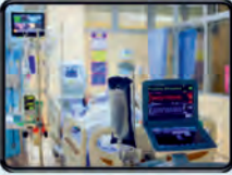
એક્સ - રે